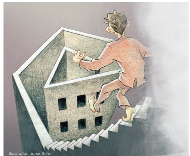
Illustration: Jonas Geise